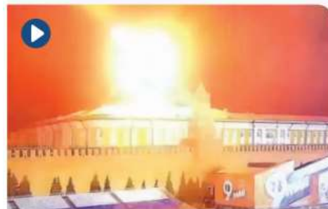
La aeronave no tripulada provoca una detonación en la zona.