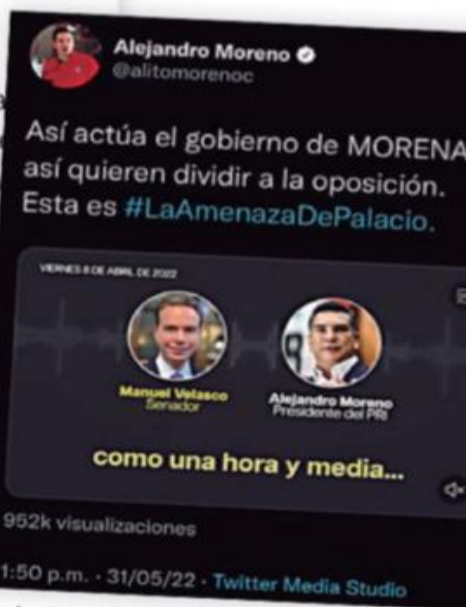
Contraataque del PRI. Denuncia