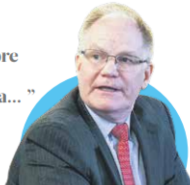
WILLIAM MALONEY Economista para AL del Banco Mundial

escasez del agua, la disponibilidad eléctrica y en general problemas que tienen que ver con logística, transporte y eficiencia portuaria.