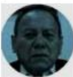
JESÚS ZAMBRANO CHUCHO QUIERE SU ESCANO

› El próximo miércoles, el TEPJF, presidido por Reyes Rodríguez , y la Jucopo de la Cámara de Diputados, encabezada por Ignacio Mier , dialogarán para destrabar el proceso de renovación de cuatro nuevos consejeros del INE. Magistrados y legisladores se reunirán en las instalaciones del Tribunal y esperan subsanar sus diferencias.