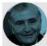
ADÁN AUGUSTO LÓPEZ

› Nos hacen ver que este domingo, en la ceremonia por el 106 aniversario de la Constitución mexicana, en Querétaro, el presidente López Obrador y la presidenta de la Suprema Corte, Norma Piña , se encontrarán por primera vez desde que ella resultó electa para el cargo. Se prevé, nos dicen, que el mandatario se limite a darle trato institucional, sobre todo porque el tabasqueño dice no confiar en los ministros del máximo órgano del país.