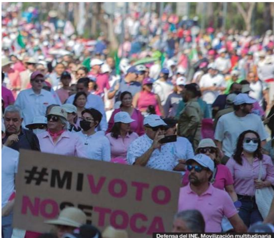
Defensa del INE. Movilización multitudinaria

Antes, en enero de 2022 la Constitución local fue reformada para obligar la elección de una mujer en 2029, si en 2023 el gobernador que se eligiera es hombre. Esa reforma también quedó invalidada por falta de consulta, aunque en este caso, por el Tribunal Constitucional local.