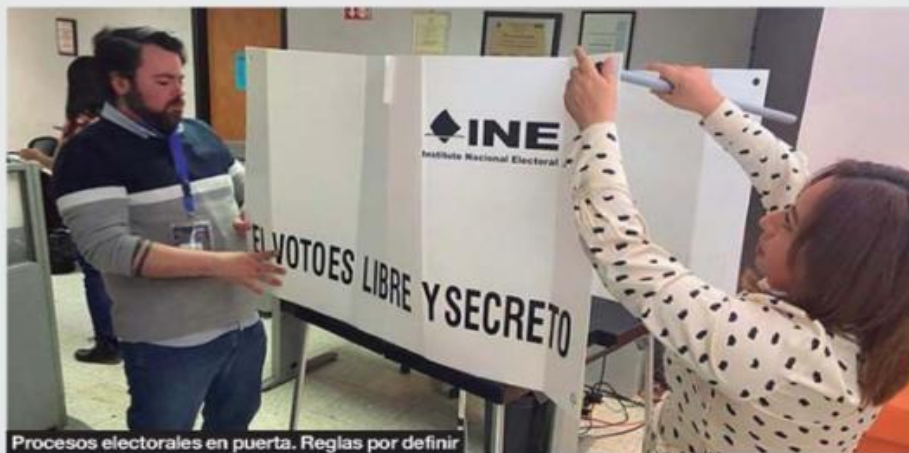
Procesos electorales en puerta. Reglas por definir

El aspecto de la falta de consulta fue consideración suficiente para invalidar toda la ley bajo el argumento del ministro Arturo Zaldívar, que expuso: “En materia electoral es muy complicado dejar algunas partes (de las leyes en revisión) y otras no”.