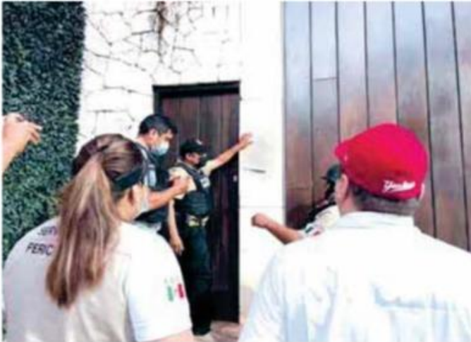
Cateo por presuntos delitos.