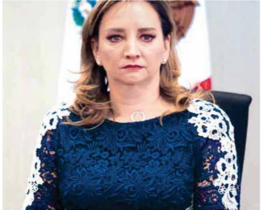
Ruiz Massieu | Incumplimiento.