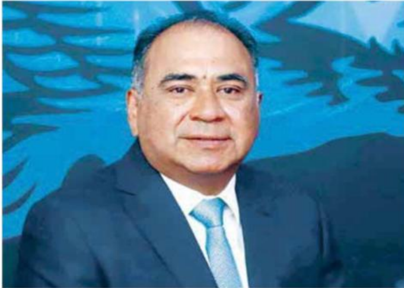
Astudillo | Renuncia.

Osorio Chong, por ejemplo, consideró que se trata de una "reforma a la medida" y añadió: "Hace unos meses Moreno aseguró a expresidentes y a la militancia que no buscaría prorrogar su dirigencia y luego convocó al CPN para hacer lo contrario".