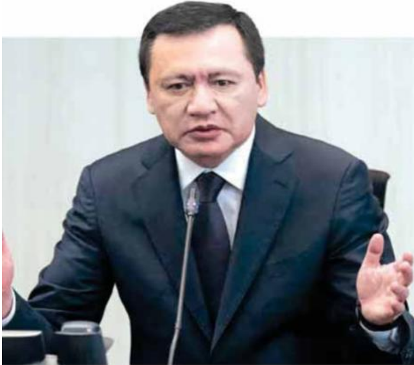
Osorio | Necesaria, nueva dirigencia.

pasadas las elecciones integraron un frente opositor en la Cámara de Diputados y se comprometieron a impulsar una agenda legislativa común.