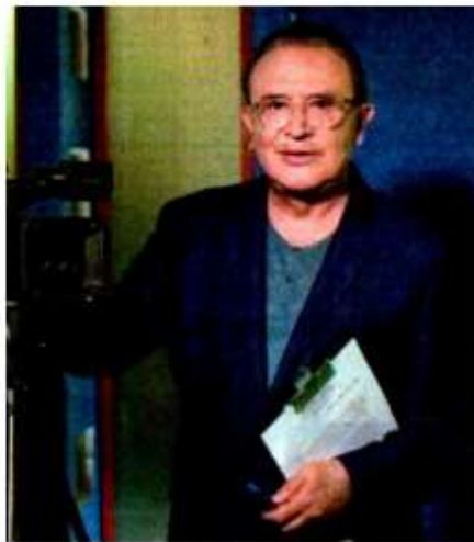
El último artículo de Ricardo Rocha para EL UNIVERSAL se publicó el 31 de mayo.

El presidente Andrés Manuel López Obrador lamentó el deceso y dijo que fueron "muy amigos". En 2019 tuvieron un diferendo cuando el Mandatario colocó a Rocha en una lista de comunicadores que recibieron contratos de Peña Nieto.