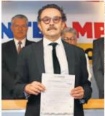
Gabriel Quadri minimizó estar en el registro de violencia política en razón de género.

Entrevistado previo a su registro como aspirante a contender para ser "responsable de la construcción del Frente Amplio por México" rumbo a las elecciones presidenciales de 2024, el legislador panista explicó que la sentencia del Tribunal Electoral del Poder Judicial de la Federación no le impide que ejerza a plenitud sus derechos políticos. ●