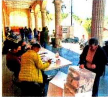
En Mineral del Monte, cercano a Pachuca, hubo fila para comprar pasteles, pero no para votar.