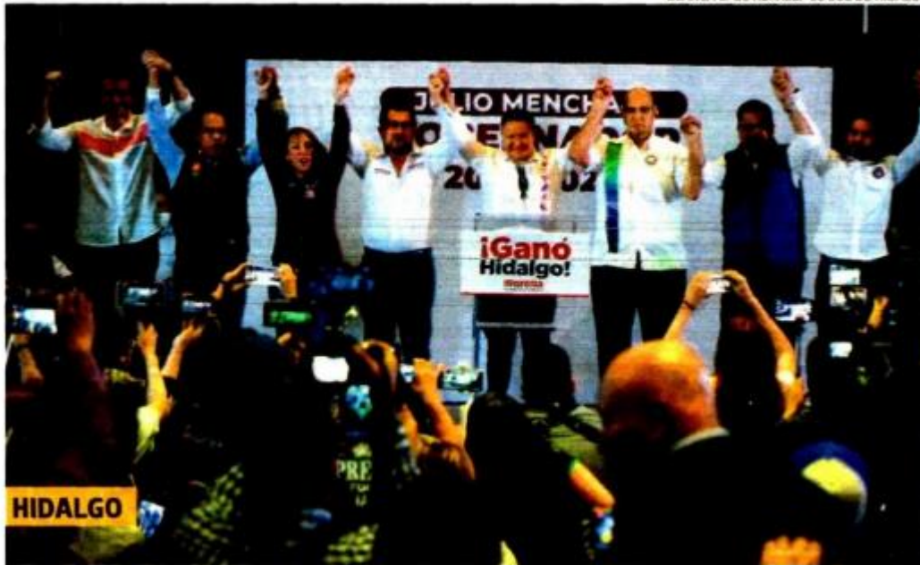
BLANCA E. GUTIÉRREZ/ EL SUR DE HIDALGO