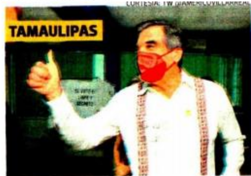
Américo Villarreal , de Morena y aliados, con ventaja