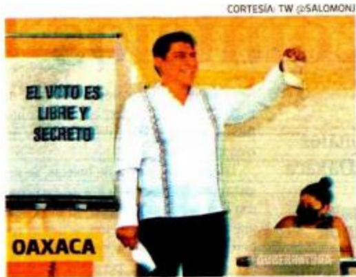
Salomón Jara , de Morena, es el virtual gobernador