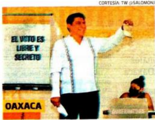
Salomón Jara , de Morena, es el virtual gobernador