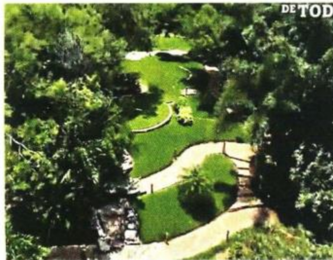
■ Prado y andadores bien cuidados, rodeados de árboles.