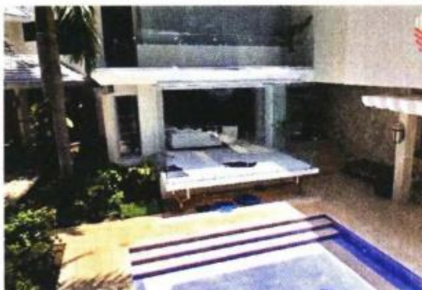
Sala anexa a la alberca, que luce vacía.