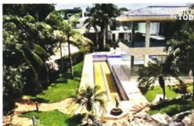
Jardinería y andenes interiores de la casa.