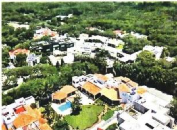
El inmueble ubicado en el Fraccionamiento Lomas del Castillo.