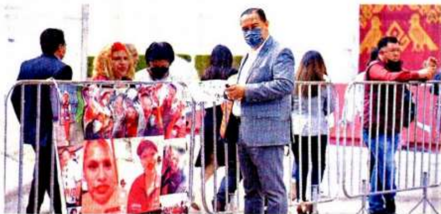
■ No faltaron algunas pancartas de protesta en las vallas metálicas colocadas en la Plaza Juárez.