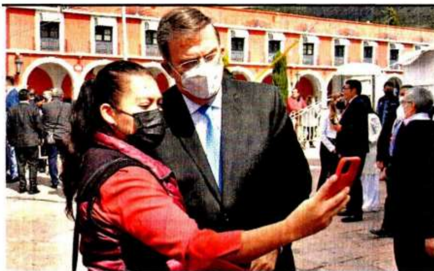
■ Claudia Sheinbaum, Jefa de Gobierno de la Ciudad de México, y Mario Delgado, dirigente nacional de Morena.