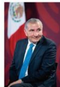
• MISIÓN. También fue a una reunión en Chiapas.

CARGOS POR DELITOS GRAVES ENFRENTA DONALD TRUMP.