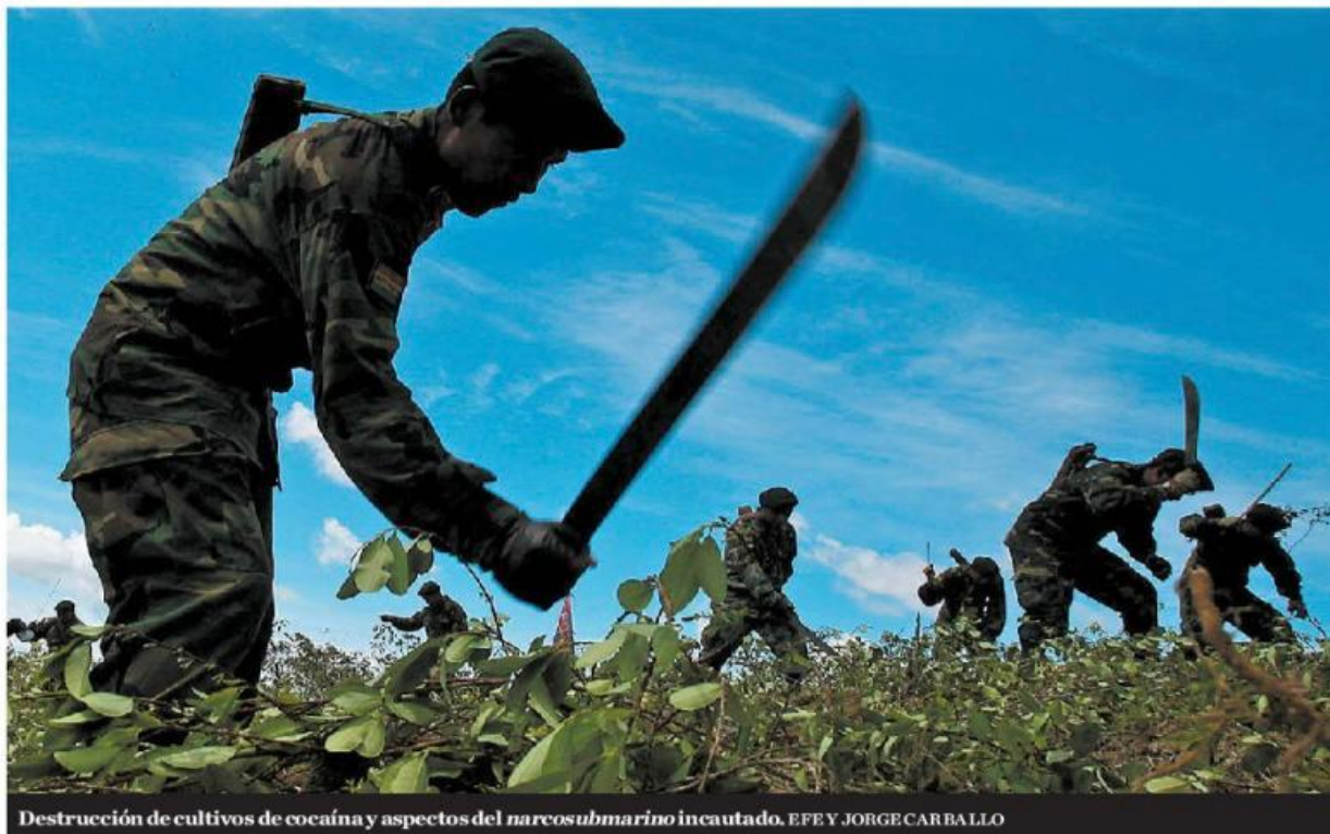
Destrucción de cultivos de cocaína y aspectos del narcosubmarino incautado.

minal e Interpol de la Policía Nacional, conocida como DIJIN, registró la captura por narcotráfico de 23 mexicanos en la capital Bogotá y en las ciudades de Cali, Medellín y Cartagena. Ya hay pedidos en extradición contra algunos de ellos.