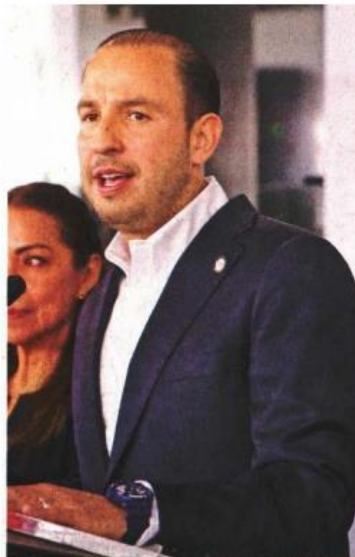
Marko Cortés, líder del PAN, responsabilizó a su homólogo del PRI de que se rompa la coalición.