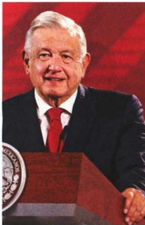
El presidente Andrés Manuel López Obrador aplaudió la iniciativa de la diputada del PRI.