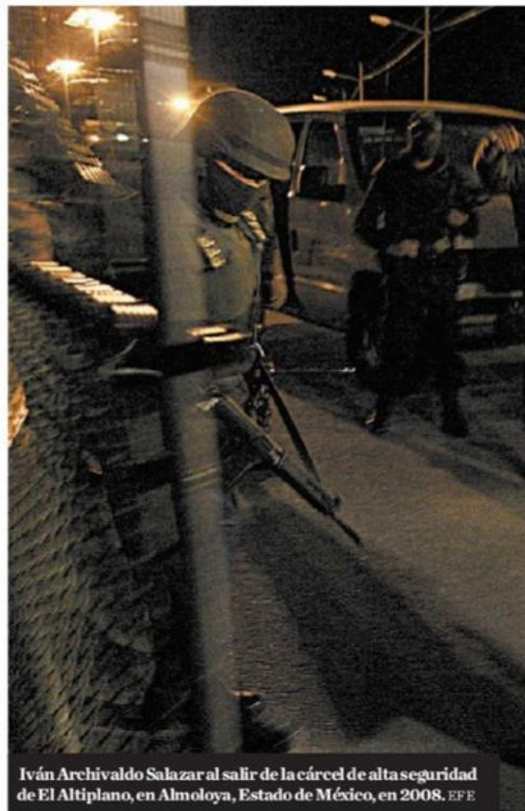
Iván Archivaldo Salazar al salir de la cárcel de alta seguridad de El Altiplano, en Almoloya, Estado de México, en 2008.

El Ejército detectó, por ejemplo, que en agosto de 2021 la di-