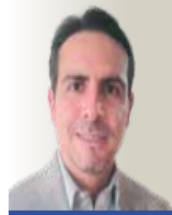
POR FERNANDO MARTÍNEZ GONZÁLEZ @FER_MARTINEZG FERMX99@HOTMAIL. COM