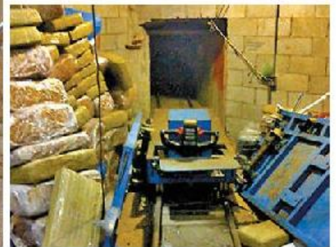
Túneles construidos para cruzar a California, Arizona y San Diego.