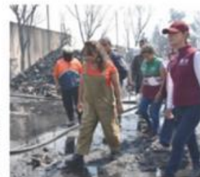
LA JEFA de Gobierno, Claudia Sheinbaum (der.), recorrió ayer la zona afectada.

Indicó que, por el momento, no se tiene un monto de pérdida, pero ya se planea una reunión con los 356 locatarios afectados, pues lo que desean es no quedarse sin trabajar