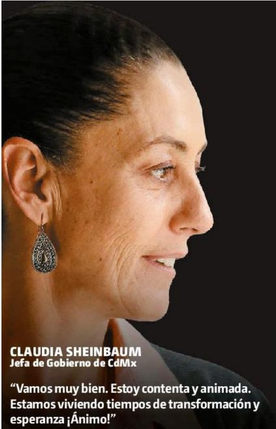
CLAUDIA SHEINBAUM Jefa de Gobierno de CdMx

“Vamos muy bien. Estoy contenta y animada. Estamos viviendo tiempos de transformación y esperanza ¡Ánimo!”