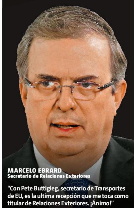
MARCELO EBRARD Secretario de Relaciones Exteriores

“Vamos muy bien. Estoy contenta y animada. Estamos viviendo tiempos de transformación y esperanza ¡Ánimo!”