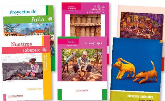
Desde López Mateos hasta Fox, el sistema educativo ha sido criticado. ESPECIAL

• FUENTE: UNPF • INFORMACIÓN: Abraham Flores • GRÁFICO: JC Fleicer