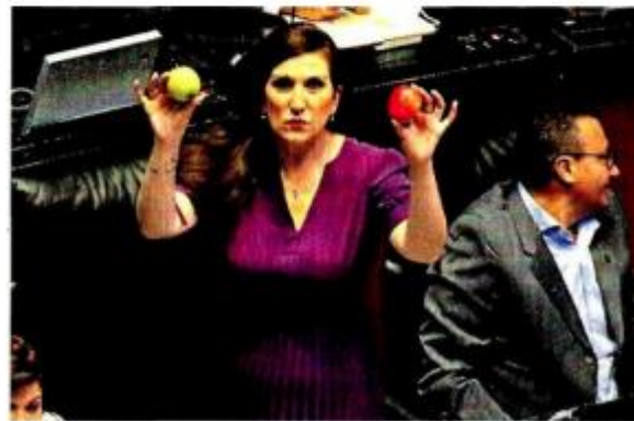
■ La senadora panista Kenia López señaló que las manzanas de Morena están podridas a causa del narco.