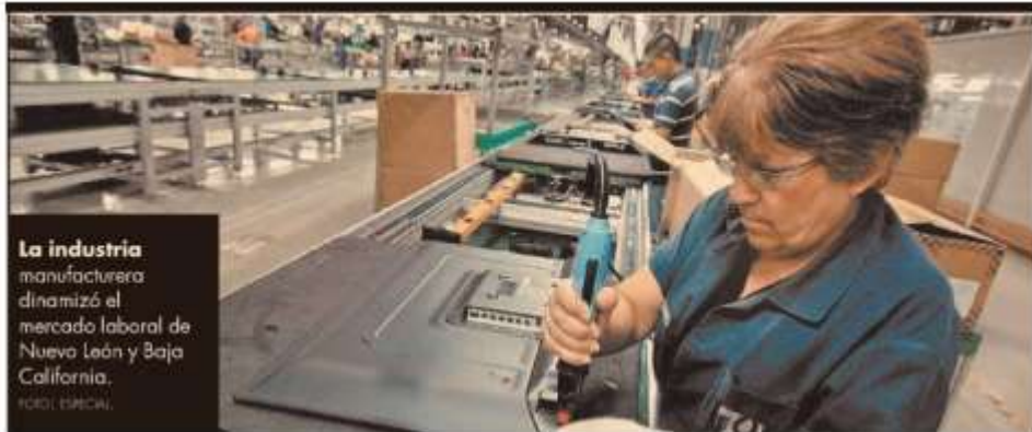
La industria manufacturera dinamizó el mercado laboral de Nuevo León y Baja California.