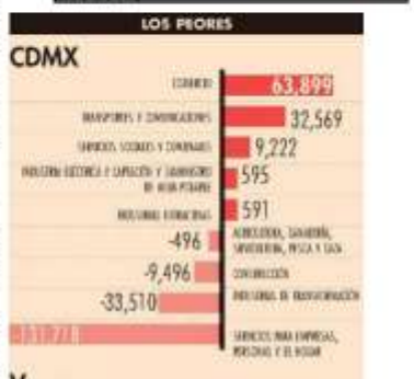
Generación de empleos formales por sectores de entidades seleccionadas | TRABAJADORES ASIGURADOS EN EL IMSS - ENTRE FEBRERO 20 Y ENERO 23 |

la merma en el sector de servicios fue el principal factor para que CDMX y Veracruz continúen sin recuperar sus niveles prepandemia en empleo formal, mientras la manufactura fue el detonador de los estados fronterizos.