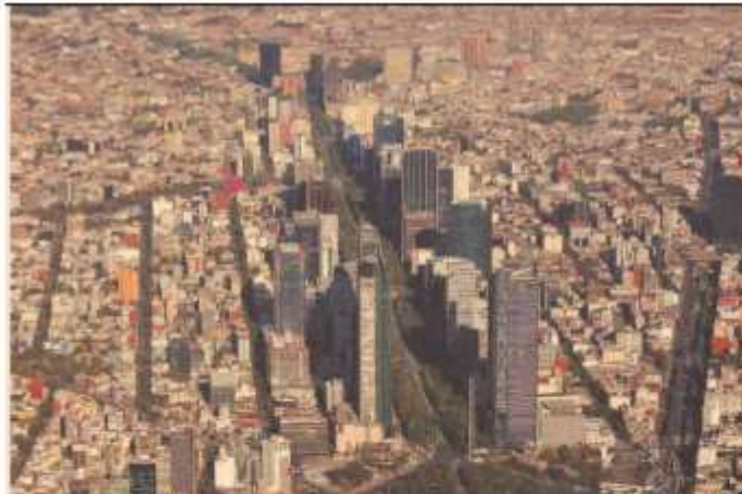
La mayor debilidad laboral de Ciudad de México y Veracruz corresponde al sector de servicios para empresas, personas y el hogar.