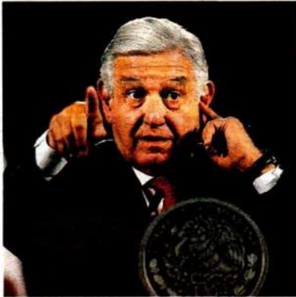
El mandatario en Palacio Nacional.