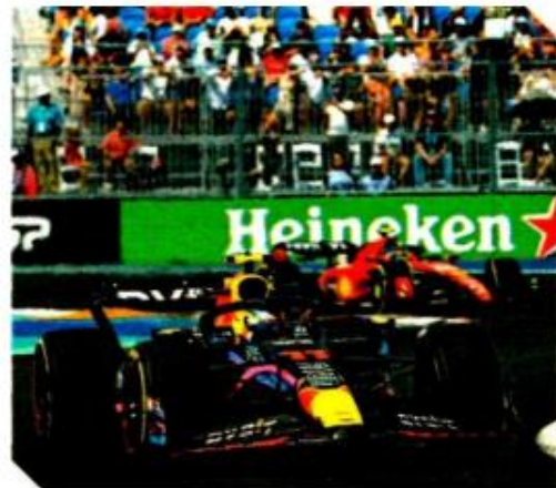
El oriundo de Guadalajara sería una de las grandes atracciones en tierra quintanarroense.

"Vamos a tener uno de los mejores festivales de música en Cancún por 15 días y va a ser histórico. Lo vamos a traer con una empresa tequilera, pero también vamos a tener un campo de golf, vamos a tener una marina increíble, vienen torres de hoteles. Esto viene en varias etapas: del 2025 al 2030 pero antes que todo está el Gran Premio de la Fórmula Uno", indicó.