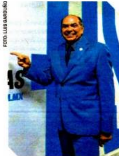
El papá de Checo, en su visita a la redacción del Diario de los Deportistas.