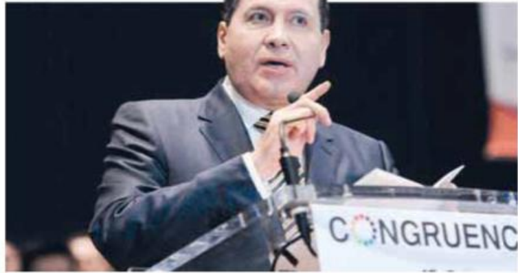
Ávila | “Cancelado el diálogo y la inclusión”.

López Obrador señaló que todo este proyecto de origen se perdió y por eso muchos integrantes del partido se están deslindando. “Pero es realmente un exceso que el dirigente del PRI me eche la culpa a mí. Eso suele pasar, ya lo hemos dicho en otras ocasiones, que si a alguien la regañan o lo regañan en