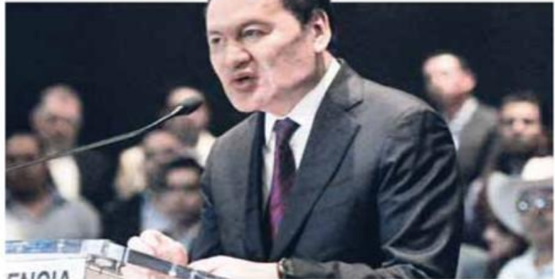
Osorio | “Hizo pedazos al partido”.

“Por encima de cualquier partido, como política, mi militancia está con México. Porque México tiene que cambiar, y los partidos tienen que cambiar; por eso, en congruencia desde donde estaba, no era posible sumar ya desde un partido con el que no