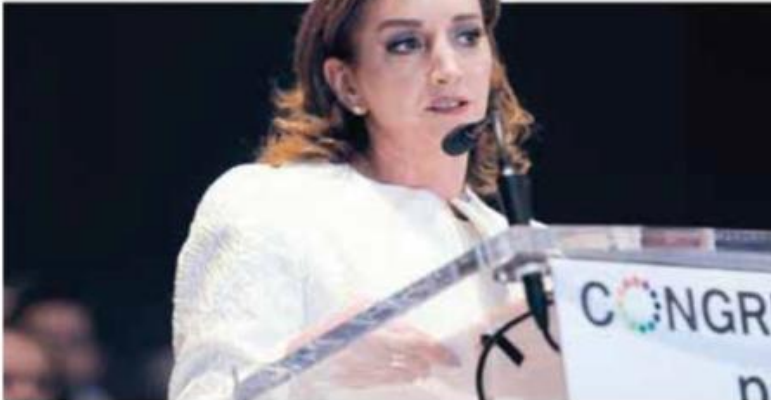
Ruiz | "Dirigencia sectaria y excluyente".

subordinación pesa más que los resultados y el compromiso. Hoy la obediencia más que las propuestas".