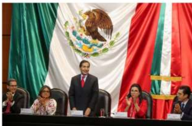
El secretario de Hacienda de México, Rogelio Ramírez de la O, en el Congreso este viernes.

El Gobierno de Andrés Manuel López Obrador ha presentado este viernes su propuesta para el gasto del próximo año, el último de su Administración, y en el que se celebrarán elecciones presidenciales. El enfoque del presupuesto, ha asegurado el secretario de Hacienda y Crédito Público, Rogelio Ramírez de la O , es la inversión social, a la cual se le asignará el equivalente al 12,8% del Producto Interno Bruto (PIB), “nivel sin precedentes”, según un comunicado.