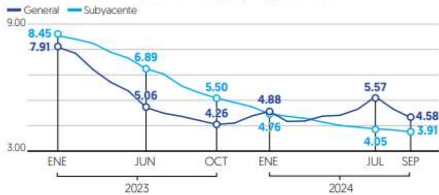
■ Inflación al consumidor, variación % anual por tipo de índice

La inflación al consumidor se mantuvo a la baja por segundo mes consecutivo, favorecida por el comportamiento de los precios de frutas y verduras.