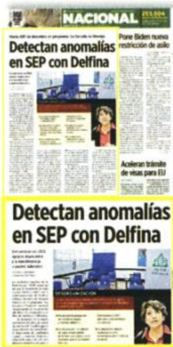
La ASF ha denunciado desorden en la SEP, pero con Delfina Gómez.

Aunque se comprometió a entregar la información en una sesión de la Comisión de Vigilancia de la ASF del 31 de marzo del 2022, el Auditor