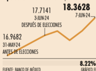
Tipo de cambio 1 semana | PESOS POR DÓLAR