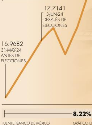
Tipo de cambio 1 semana | PESOS POR DÓLAR

Los inversionistas abandonaron el peso y salieron del mercado, lo que se reflejó en la cotización de la moneda frente al dólar