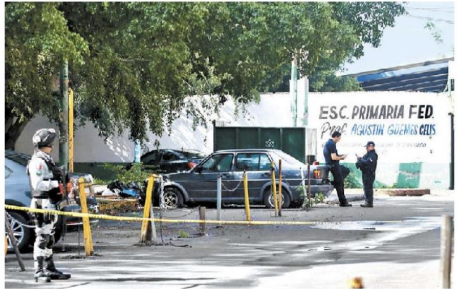
Dejan cadáver envuelto en bolsas cerca de una primaria en Cuernavaca.

• FUENTE: Artículo 19 • INFORMACIÓN: Karina Martínez • GRÁFICO: Juan Carlos Fleiser