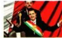
2012-2018: ENRIQUE PEÑA NIETO