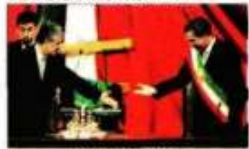
1994-2000: ERNESTO ZEDILLO