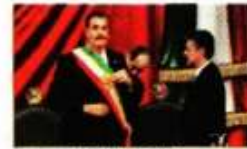
2000-2006: VICENTE FOX