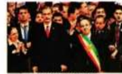
2006-2012: FELIPE CALDERÓN