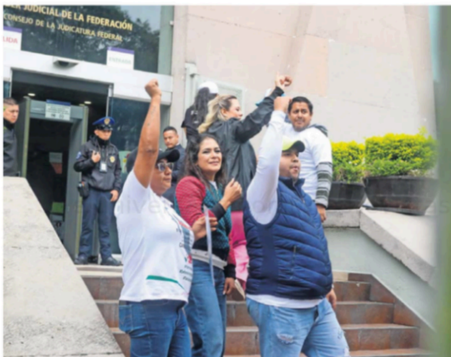
En esta división al interior del Poder Judicial de la Federación los más afectados son los trabajadores, señalaron jueces y magistrados.