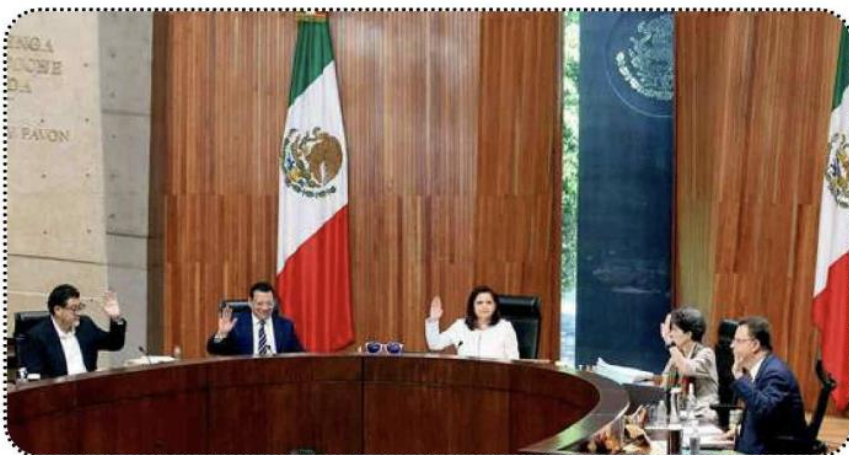
Integrantes Tribunal Electoral del Poder Judicial de la Federación (TEPJF)

Al ordenar dichas medidas cautelares, la Unidad Técnica de lo Contencioso Electoral del INE argumentó que, con sus expresiones,