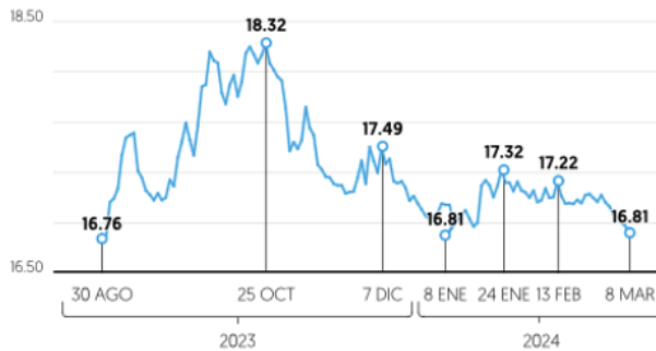
Dólar interbancario Cierre diario, en pesos por divisa

El peso mexicano cerró la semana anterior en su mejor nivel frente al dólar de EU desde agosto de 2023, y de paso se colocó entre las divisas que más se han fortalecido frente al billete verde.