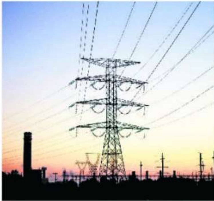
Autoridades prevén que la demanda de electricidad mantendrá su crecimiento al menos hasta 2030.