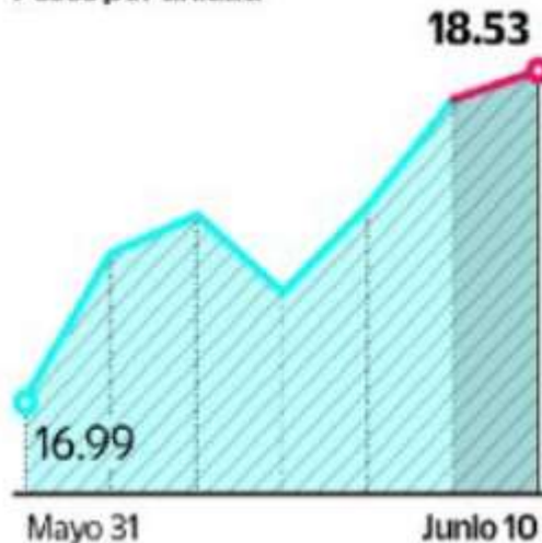
Índice de la BMV