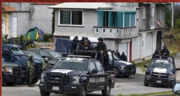
Elementos de la Guardia Nacional y la Secretaría de la Defensa Nacional resguardan la zona.