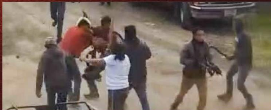
14 personas murieron en el enfrentamiento entre pobladores e integrantes del crimen organizado.