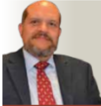
POR JULIÁN ANDRADE