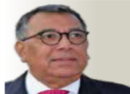
POR ROBERTO VIZCAINO RVIZCAINO@ GMAIL.COM TWITTER: @VIZCAINO FACEBOOK WWW.FACEBOOK.COM/ RVIZCAINO