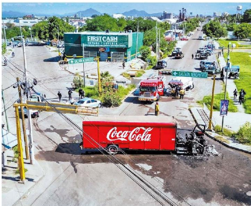
Hombres armados incendiaron un tráiler de una empresa refresquera.