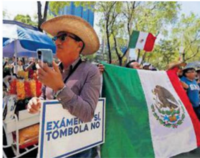
Decenas de juzgadores protestaron afuera del Senado