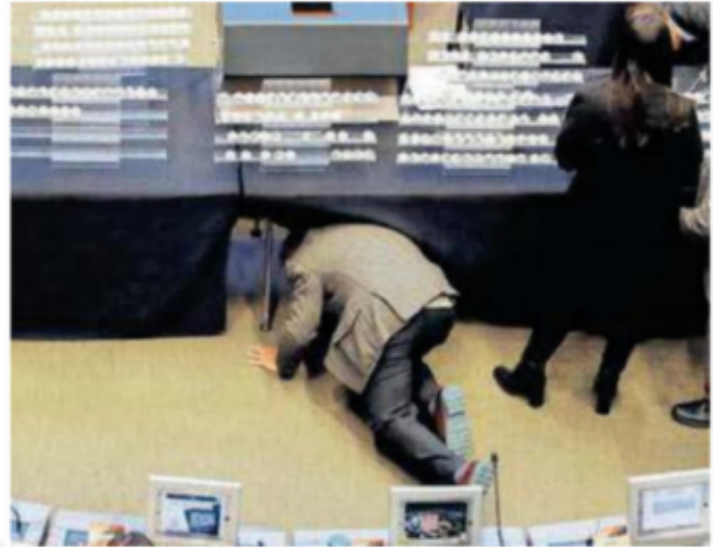
Algunas esferas para la tómbola se cayeron