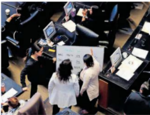
El proceso inició con el quórum mínimo