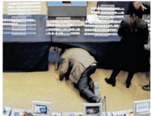
Algunas esferas para la tómbola se cayeron