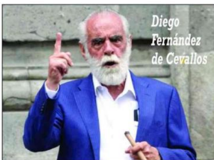
Diego Fernández de Cevallos

res del PRI, PAN y PRD, Alejandro "Alito" Moreno Cárdenas, Marko Cortés Mendoza y Jesús Zambrano Grijalva , respectivamente, por su desempeño y los resultados de las elecciones del 2 de junio de 2024 .