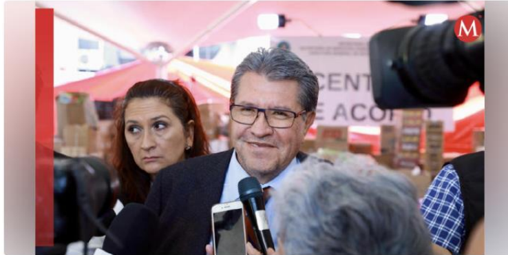
L. Morena.poder judicial,ricardo monreal,Reforma judicial,cámara de diputados

El líder parlamentario de Morena en la Cámara de Diputados, Ricardo Monreal , advirtió que “no habrá marcha atrás” en la implementación de la reforma al Poder Judicial.