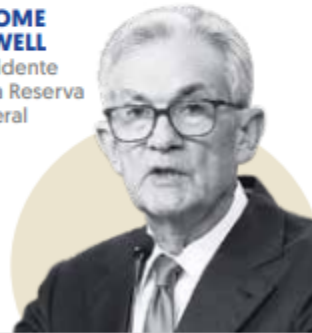
JEROME POWELL Presidente de la Reserva Federal

"... estamos totalmente comprometidos a devolver la inflación a nuestra meta del 2%"