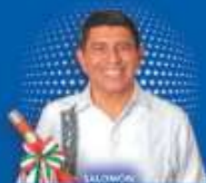
SALOMÓN JARA CRUZ Gobernador de Coahuila