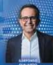
RUFORINO GUAJARDO Diputado Federal en la LXV Legislatura de la H. Cámara de Diputados