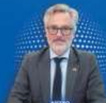
PIETRO PIFFARETTI Embajador de Suiza en México