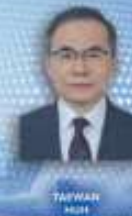
TAIWAN HSU Embajador de Corea en México