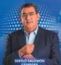
SERGIO SALOMÓN CEPOMEX Gobernador de Puebla