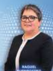
RAQUEL BUENROSTRO Secretaría de Economía