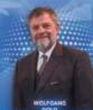
WOLFGANG SOLD Embajador de Alemania en México