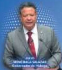
JULIO MENCHACA SALAZAR Gobernador de Hidalgo