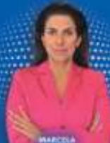
MARCELA GUERRA Presidenta de la Mesa Directora de la Cámara de Diputados