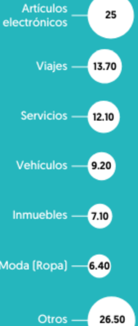
■ % Productos o servicios en donde se concentran las estafas

Los artículos electrónicos, viajes y servicios concentran el 50.8% de las estafas revelan datos del Consejo Ciudadano.