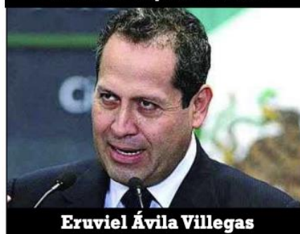
Eruviel Ávila Villegas

tido en el poder", nada más. Sin embargo, las acciones se cuantifican cuando el Estado de México por décadas fue un bastión priista por naturaleza, y gracias a esos no traidores, si no vendidos, la entidad mexicana pierde su "identidad partidista", a pesar de que Morena gobierna en la mayoría de los municipios. Parece increíble, pero así es. El hecho de que Morena predomine, no significa que la identidad de los mexicanos sea esa, morenista, pero tampoco hay garantía de que el PRI pueda, como dice Chuayffet , recobrar la confianza de los mexicanos, si gente como Alfredo del Mazo Maza , miembro de una dinastía de gobernadores priistas; se alió con la izquierda para no ir a la cárcel y perder su patrimonio!, como sea, se fue por poder y dinero valiéndole un camino su parentela priista.