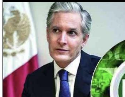
Alfredo del Mazo Maza