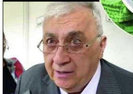
Emilio Chuayffet Chemor